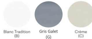
Blanc Tradition (B)