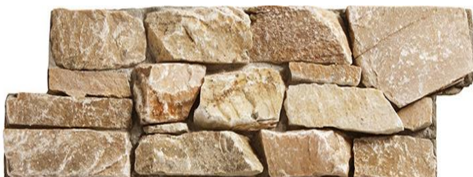
Orient - PLQSTONEROCKOR