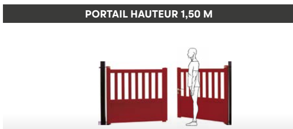
PORTAIL HAUTEUR 1,50 M

La hauteur du pilier et du portail n'est pas qu'un choix purement esthétique, il permet de vous protéger des regards indiscrets et de mieux sécuriser votre propriété.