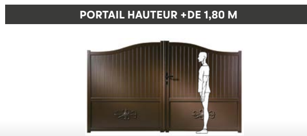
PORTAIL HAUTEUR +DE 1,80 M

➤ Nos kits portail/portillon adaptés aux dimensions standards, mais évolutif pour faire du sur-mesure.