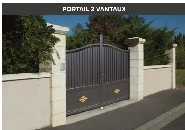
PORTAIL 2 VANTAUX

Vos piliers doivent supporter le poids du portail, son système mécanique et les mouvements répétitifs d'ouverture et de fermeture. Vous devrez définir l'espace nécessaire et le type d'ouverture (latérale, intérieure ou extérieure).