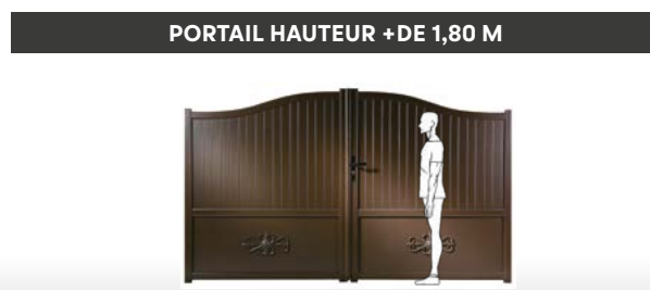
PORTAIL HAUTEUR +DE 1,80 M

➤ Nos kits portail/portillon adaptés aux dimensions standards, mais évolutif pour faire du sur-mesure.